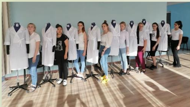
2021 ГИА в виде демонстрационного экзамена в группе 3.4 профессия Закройщик