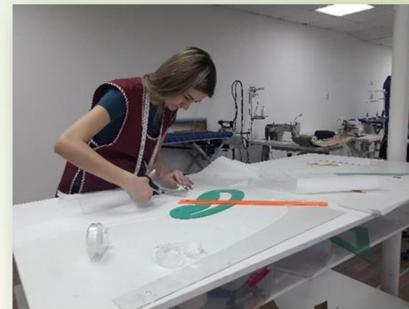
2022 ПА в виде демонстрационного экзамена в группе 4.13 специальность КМиТШИ