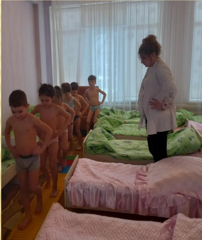
Организация и проведение бодрящей гимнастики после дневного сна

Производственная практика ПП01.02. «Организация мероприятий, направленных на укрепление здоровья ребенка и его физического развития»