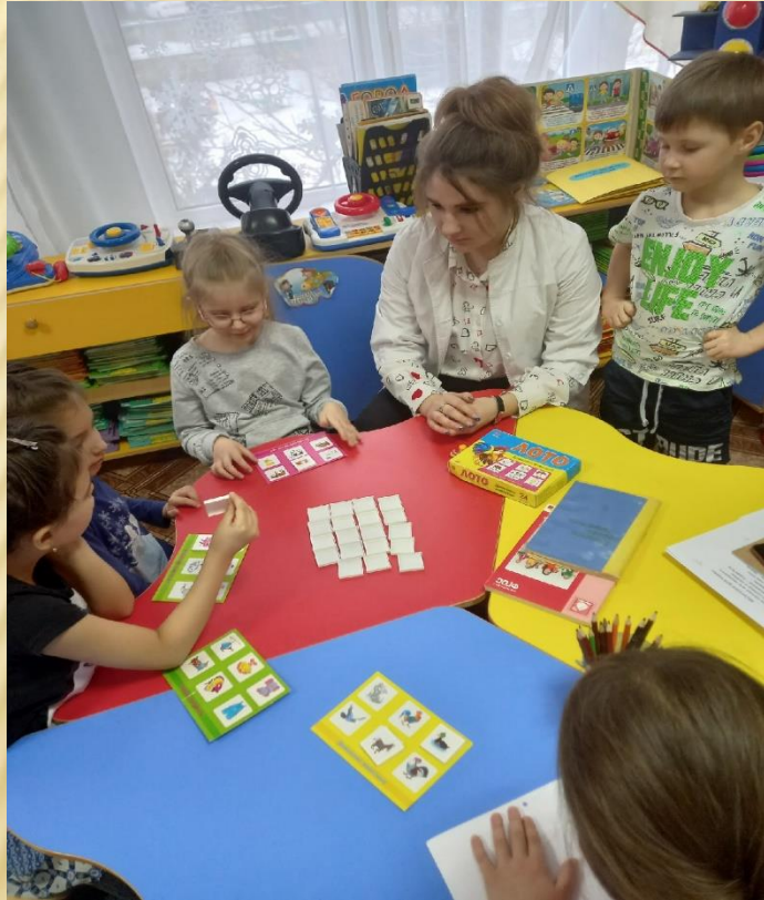
Организация и проведение дидактических игр

Производственная практика ПП 02.02.«Организация различных видов деятельности и общения детей»