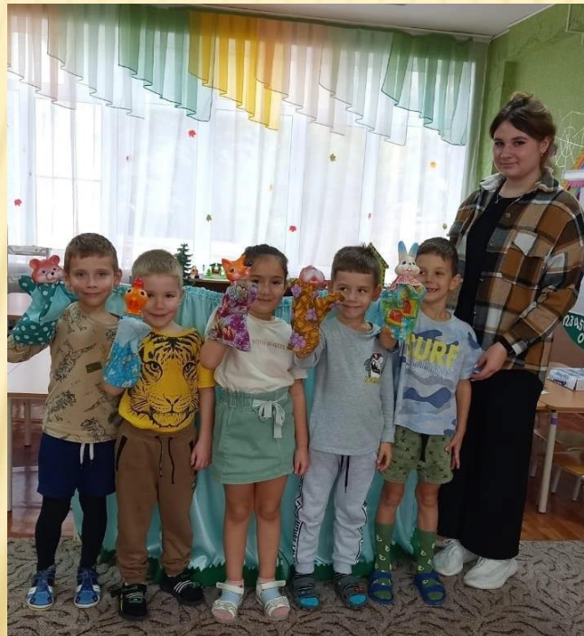
Организация и проведение театрализованных игр

Производственная практика ПП 02.02.«Организация различных видов деятельности и общения детей»