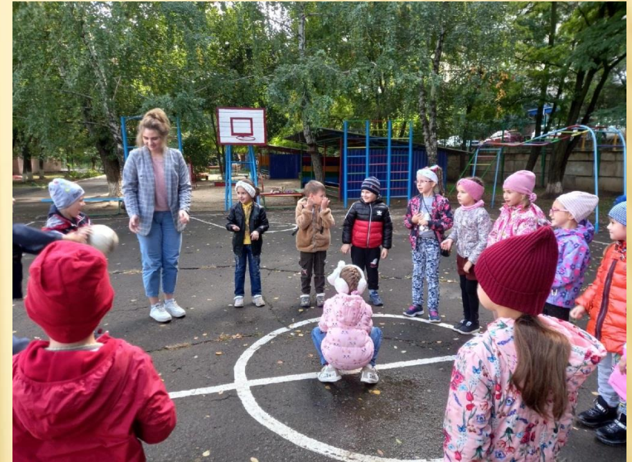
Организация подвижных игр на прогулке

Производственная практика ПП 01.02 «Организация мероприятий, направленных на укрепление здоровья ребенка и его физического развития»