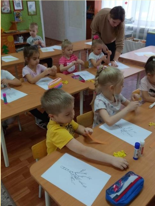
Организация и проведение занятия по аппликации