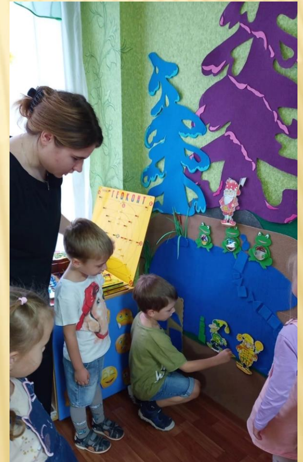
Организация и проведение занятия по формированию математических представлений