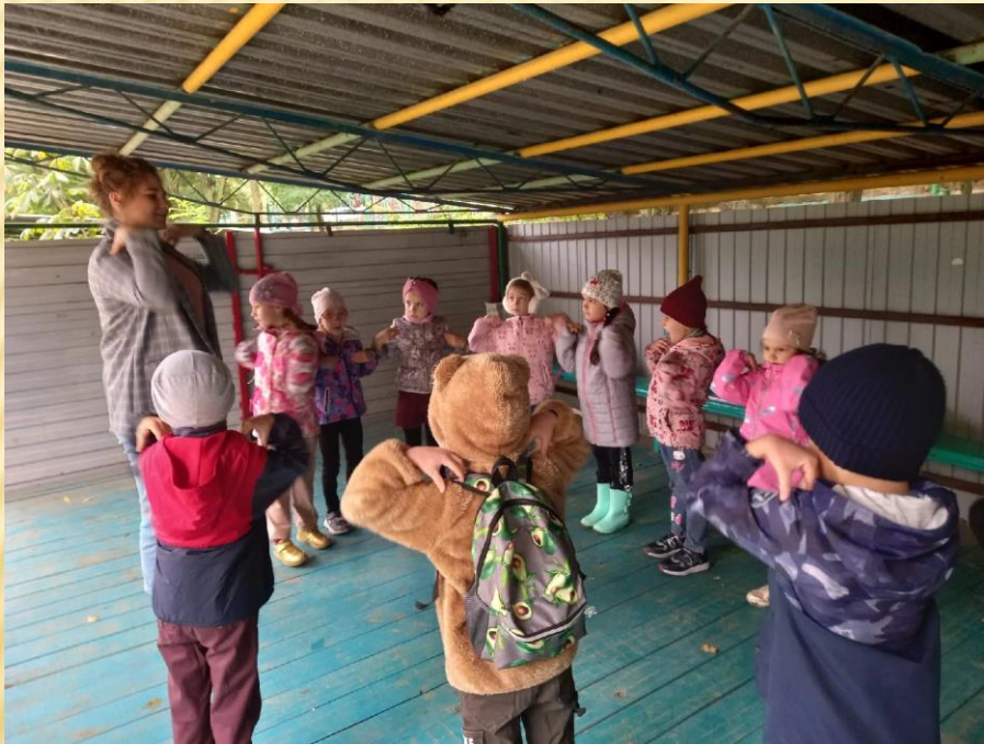
Организация и проведение утренней гимнастики

Производственная практика ПП 01.02 «Организация мероприятий, направленных на укрепление здоровья ребенка и его физического развития»