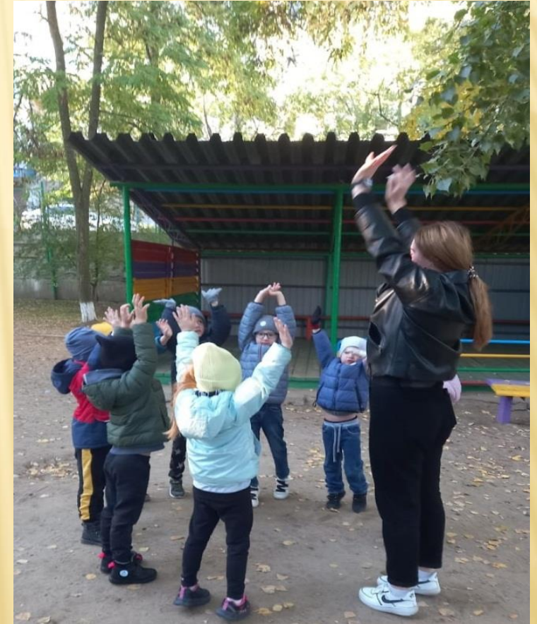
Организация и проведение подвижных и малоподвижных игр