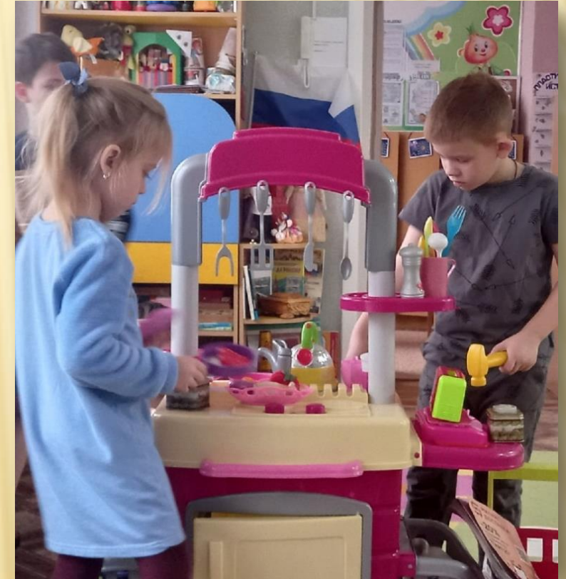
Организация и проведение сюжетно-ролевых игр