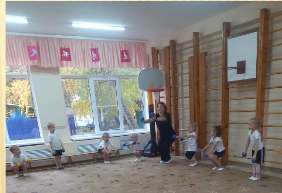
Организация и проведение занятий по физическому развитию

Производственная практика ПП 01.02 «Организация мероприятий, направленных на укрепление здоровья ребенка и его физического развития»