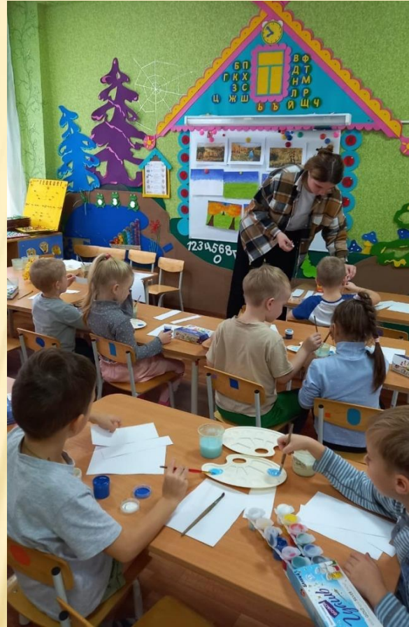
Организация и проведение занятия по рисованию