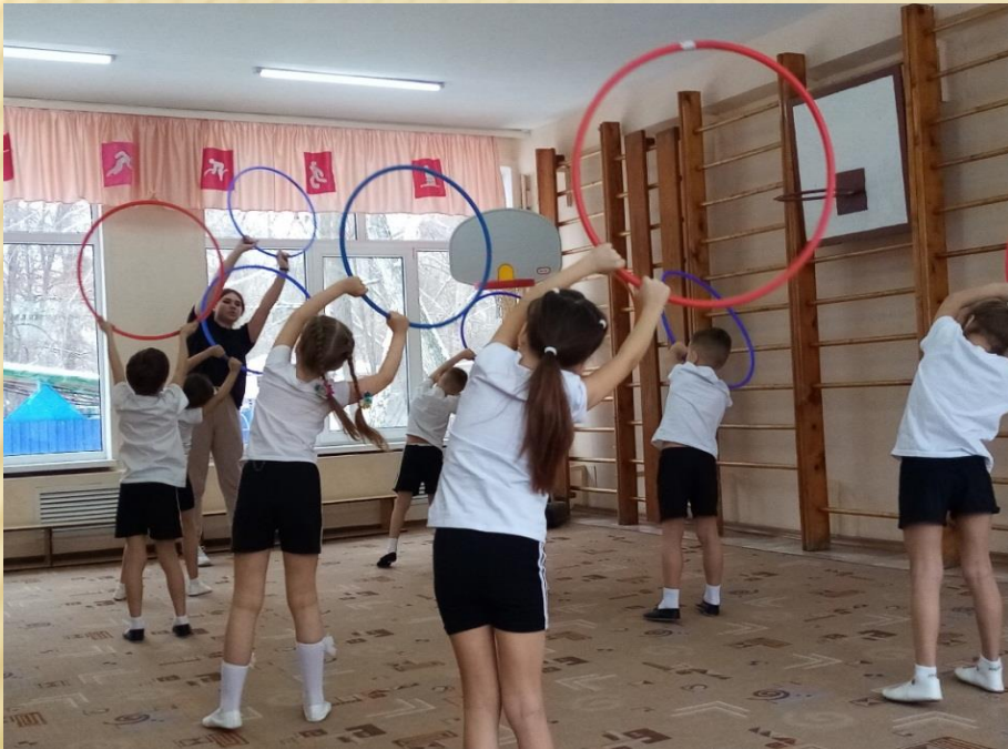
Организация и проведение занятий по физическому развитию

Производственная практика ПП 01.02 «Организация мероприятий, направленных на укрепление здоровья ребенка и его физического развития»