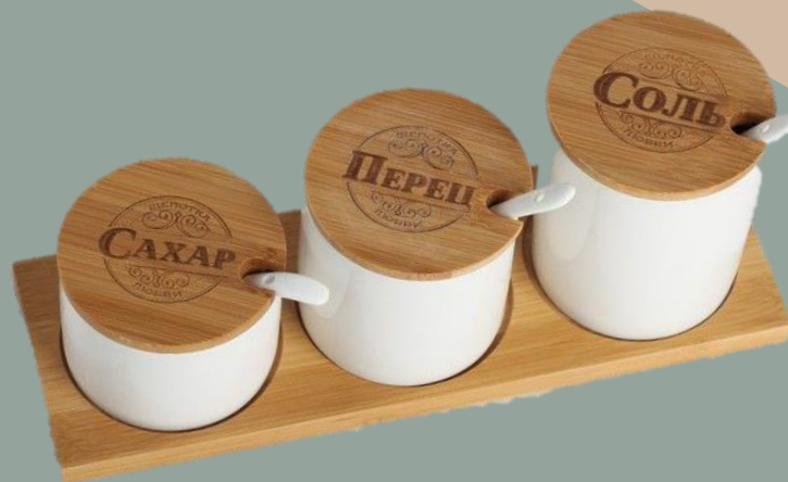
Сахар, соль, перец черный молотый, перец душистый молотый